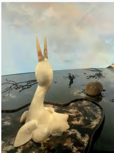
Fra Nasjonalmuseets utstilling med Laure Prouvost. Utstillingen varer til 12. februar.

Ifølge Norsk institutt for naturforskning, NINA, er mer enn 60 prosent av de norske sjøfuglartene ført opp i Norsk rødliste for arter. Det betyr at de står i fare for å dø ut.